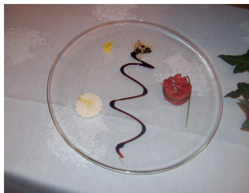
La tartare di manzo